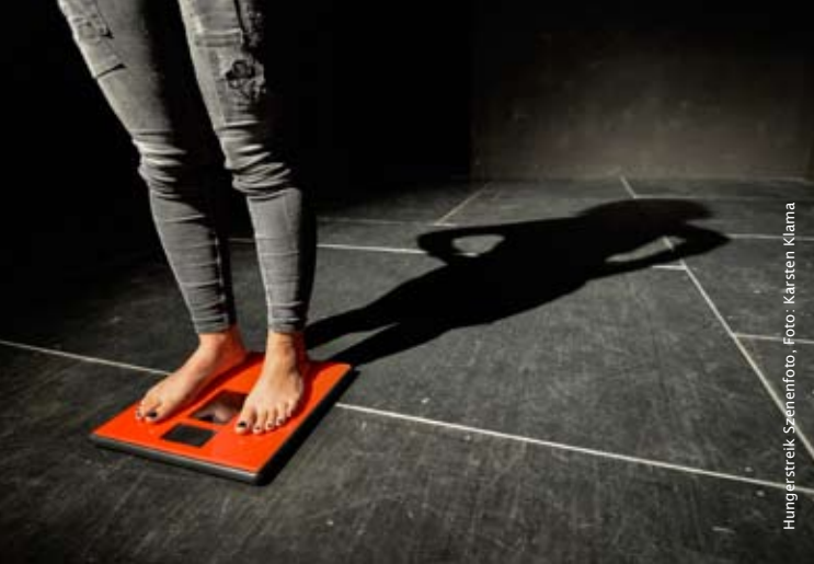
Hungerstreik Szenenfoto